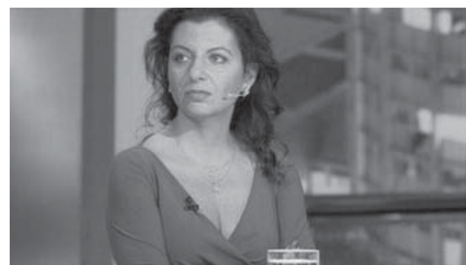
Антисоветизм от Маргариты Симоньян: когда я была маленькой, наша семья жила в СССР гораздо хуже, чем собаки наших родственников в Голландии. Окно в историю. 30 декабря 2022

Так вот, а почему же Маргарита Симоньян все эти 30 лет молчала о том, что всё наше российское общество по воле её «верхов», начиная с Ельцина и заканчивая нынешними временами, как раз и строилось на идее безудержного потребительства, поклонения, так сказать, золотому тельцу, поклонению мамоне? Ведь в первую очередь, на мой взгляд, этому мамону поклонялась и продолжает поклоняться именно российская «элита».