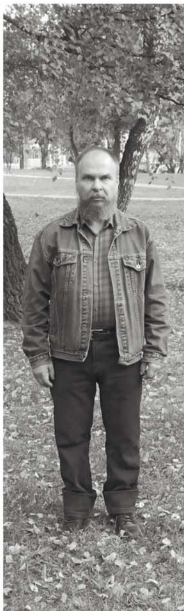
На фотографии изображен мужчина с именем Один, находящийся в мироздании являющегося его неотъемлемой частью